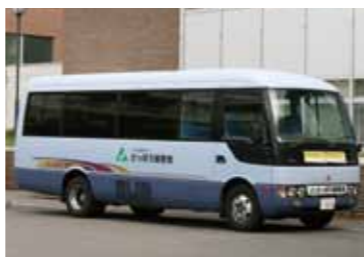
主に運行しているマイクロバスです