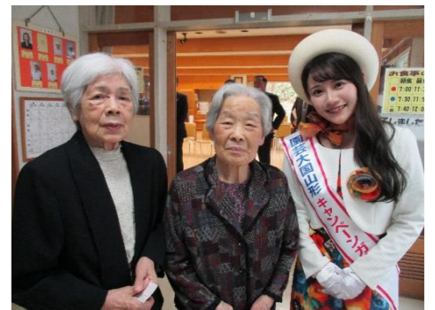
山形県鶴岡市から 柿の寄贈式