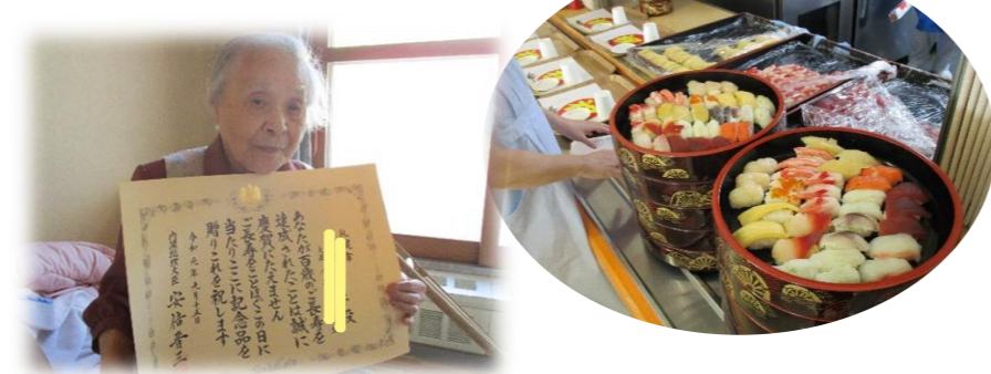
100歳のお祝いに賞状 が届きました