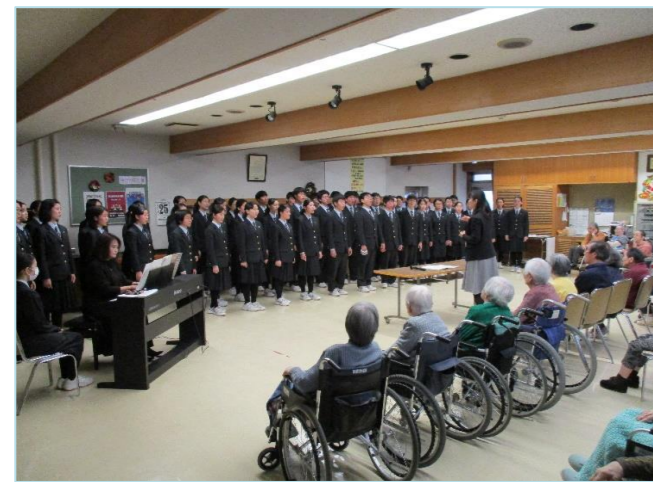
旭ヶ丘高校の合唱部 による聖歌などを披 露してくださいました