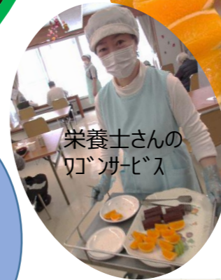
栄養士さんの ワッシャーサービス