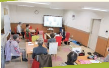
サロン『いきいきサロンふきのとう』の様子