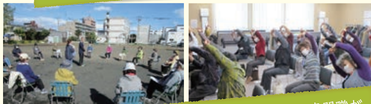
お医者さんや看護師さん、リハビリの先生など専門職が講師として来てくれる教室