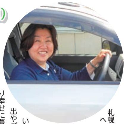
札幌市稲寿園 ヘルパーステーション