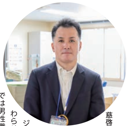
慈啓会介護総合相談センター