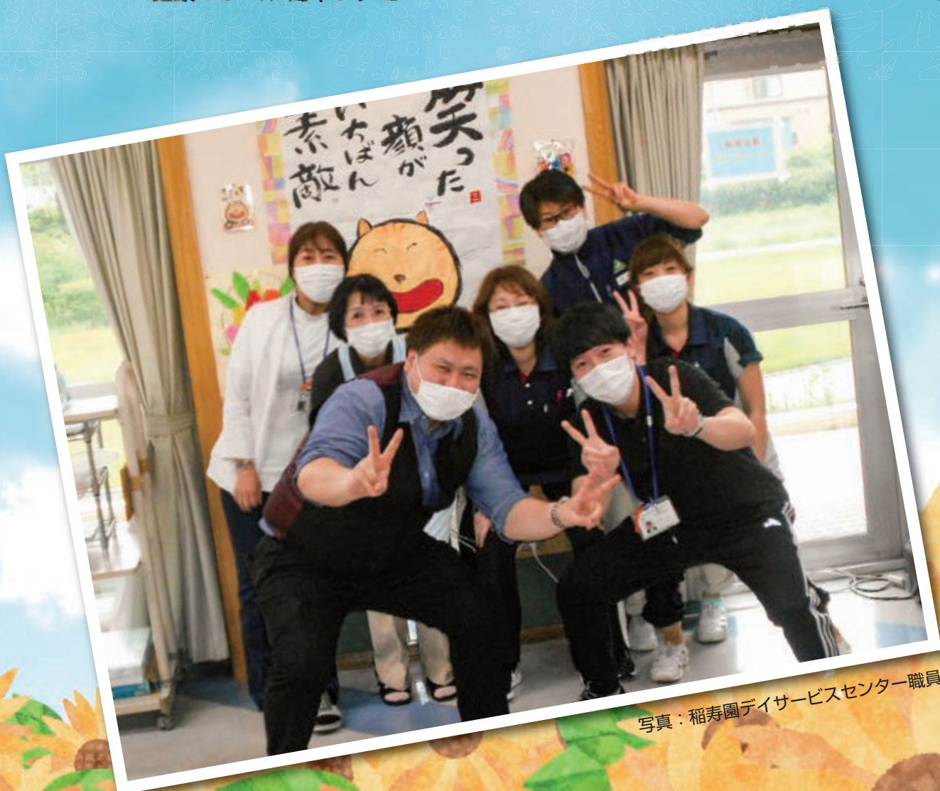
写真：稲寿園デイサービスセンター職員