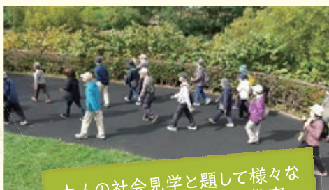
大人の社会見学と題して様々な場所をウォーキングする教室

すこやか倶楽部や運動教室など、地域の皆さまが介護予防や健康管理の必要性に気づき、自身で取り組むためのきっかけ作りになるような教室開催を心がけております！