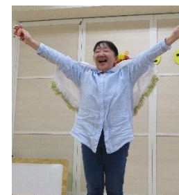
わたしは福の神様！