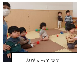
鬼が入って来て、 固まっている0歳児さん