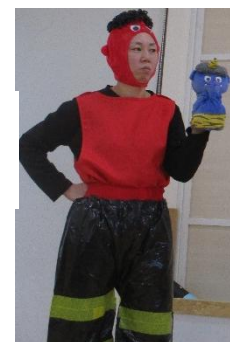
泣き虫鬼 怒りんぼ鬼