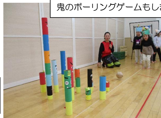
鬼のボーリングゲームもしました