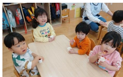
鬼を退治した後は、 みんなでこつぶっこを食べました