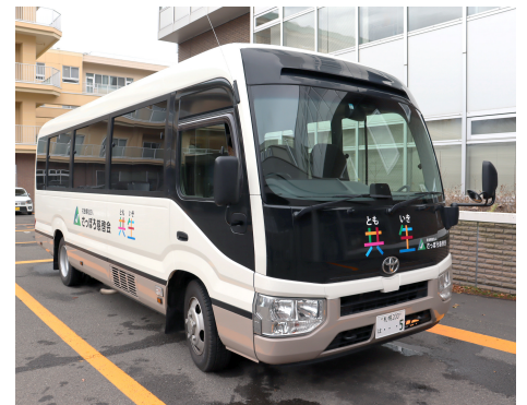
(主に運行しているマイクロバスです)